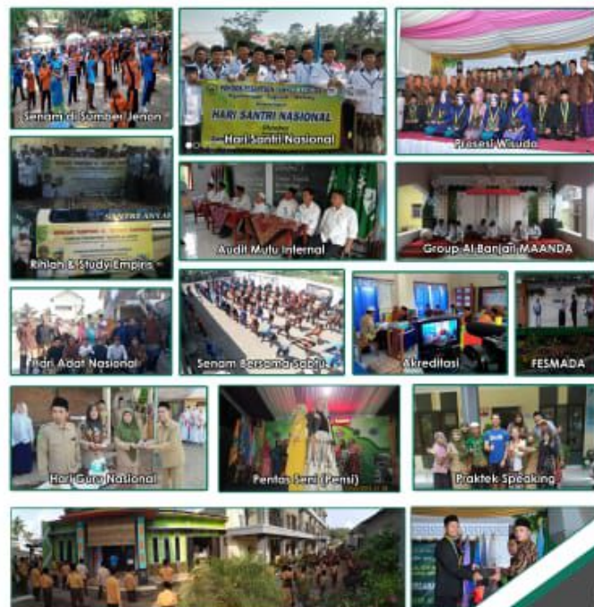
Foto Kegiatan Madrasah

Berikut adalah sebagian foto-foto Kegiatan dan Ekstrakurikuler di MA Annur Al Huda yang sudah berjalan setiap hari sabtu: