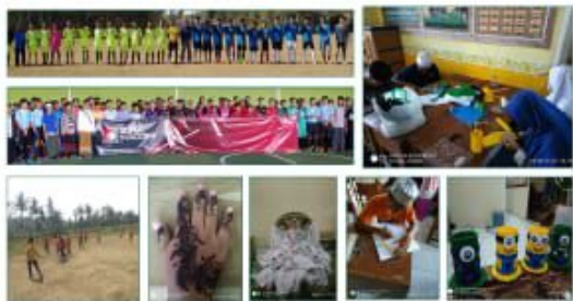
FOTO KEGIATAN EKSTRAKURIKULER

Galleri Foto-foto Kegiatan yang lain dapat di lihat di link : ma.annuralhuda.com/ppdb/gallery.php